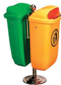
Слика 6. Контејнери и канте за прикупљање отпада