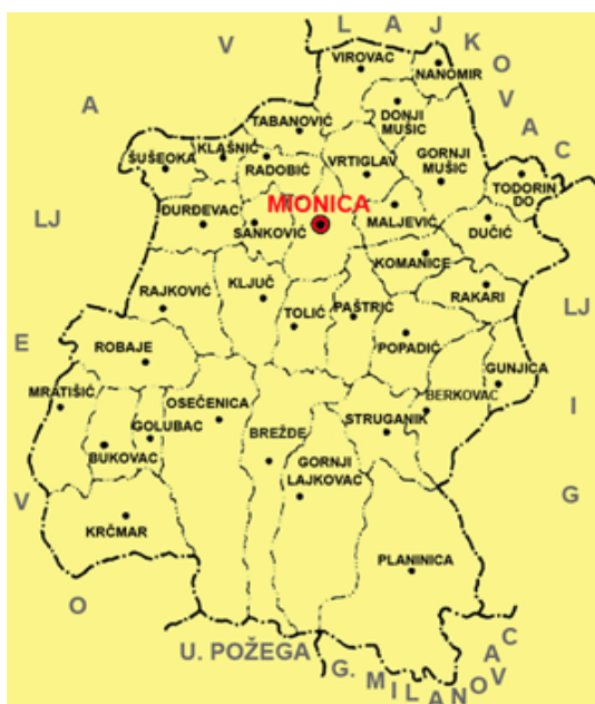
Слика 2. Мапа општине Мионица

У општини има 36 насељених места, и то место Мионица Варош и 35 села: Берковац, Брежђе, Буковац, Вировац, Вртиглав, Велика Маришта, Голубац, Горњи Лајковац, Горњи Мушић, Гуњица, Доњи Мушић, Дучић, Ђурђевац, Клашнић, Кључ, Команице, Крчмар, Маљевић, Мионица Село, Мратишић, Наномир, Осеченица, Паштрић, Планиница, Попадић, Радобић, Рајковић, Ракари, Робаје, Санковић, Струганик, Табановић, Тодорин До, Толић и Шушеока.