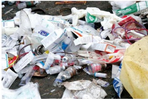
Слика 9. Неадекватно одлагање медицинског отпада

Као и за већину других врста отпада, у Србији постоји врло ограничен број поузданих података о настајању медицинског отпада, било да се ради о биохазардном медицинском отпаду или о укупном отпаду из здравствених установа.