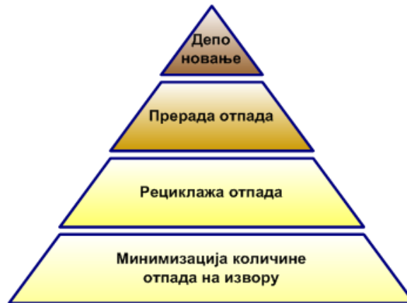
Слика 1. Циљеви управљања отпадом

Изработом наведеног плана елиминисаће се актуелни проблеми на подручју општине Мионица где до сада није успостављен систем управљања отпадом: