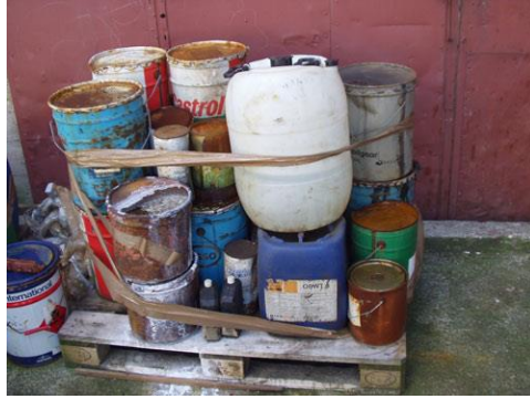
Слика 8. Опасан отпад