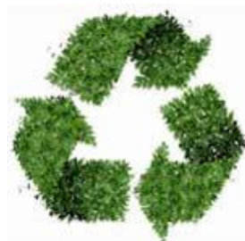
Слика 14. Знак рециклаже

Рециклажа је поступак враћања корисних материја из отпада у поновни процес при чему се иницијална намена отпада може мењати. Овај поступак је значајан како код индустријског отпада тако и код комуналног и у оба случаја се остварују значајни технички, еколошки и економски ефекти.