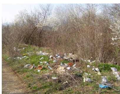
Слика 5. Непримерено одлагање отпада

Неадекватно прикупљање, транспорт или неправилно одлагање комуналног отпада може да има неповољан утицај на животну средину, као што је: