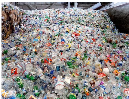
Слика 9. Амбалажни отпад