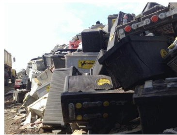
Слика 10. Истрошене батерије и акумулатори