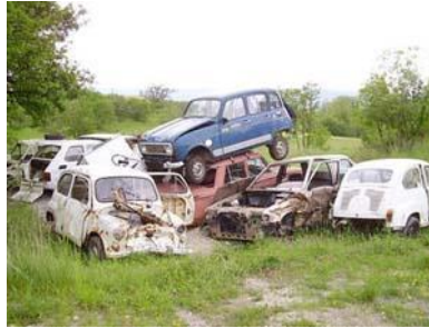
Слика 11. Ислужена возила