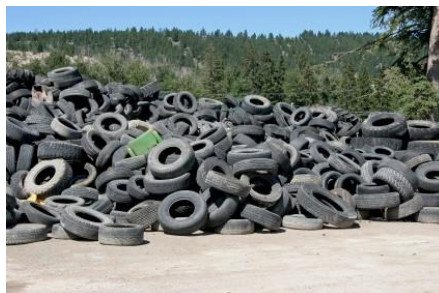
Слика 12. Отпадне гуме