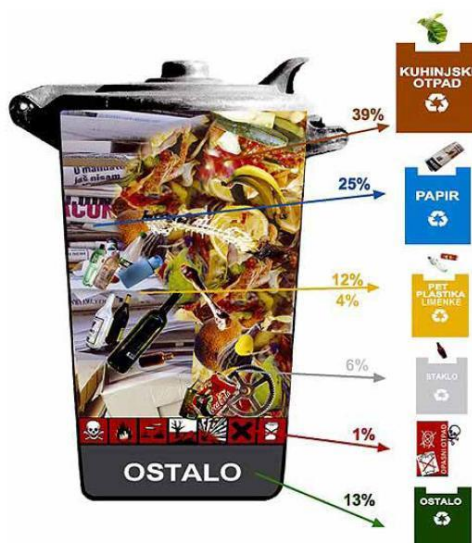
Слика 4. Комунални отпад

Отпад из домаћинства (комунални отпад) се уобичајено не сматра опасним отпадом, с обзиром да се састоји од материјала којим је пре коначног одлагања руковао појединац. Међутим, ова врста отпада може да варира у саставу, а то у великој мери зависи од начина живљења „произвођача“ отпада. Амбалажа чини значајан део комуналног отпада. Следе материјали који су одбачени при припремању хране као што су љуске од воћа и поврћа, остаци од меса, кости и слични материјали који се не могу рециклирати.