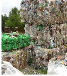
Слика 7. Бале од пресоване ПЕТ амбалаже

На основу уговора са рециклажним центром „Пима“ - Чачак се врши откуп бала од пресоване ПЕТ амбалаже и папира, док третман преосталог отпада, односно након издвајања секундарних сировина (ПЕТ амбалажа и папир) се одвози на депонију у ЈПКП „Лазаревац“.