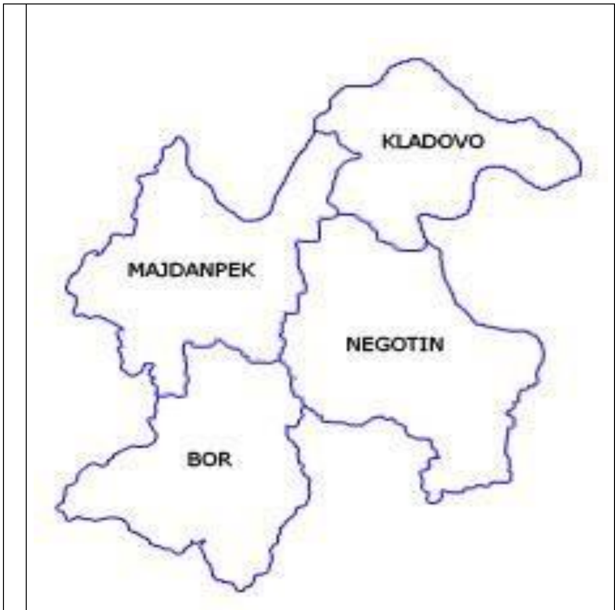
Слика 2. - Приказ положаја општине Кладово у оквиру Борског управног округа

Административно, привредно и културно средиште општине је град Кладово. Кладово се убраја у старије градове у Подунављу, а настанак насеља се везује за војно цивилни логор који су подигли римљани на граници, познат под именом Занес. Када је логор разорен, Словени су на његовим темељима подигли своје насеље Нови Град чији остаци се налазе непосредно пре уласка у савремени град идући Ђердапском магистралом у правцу од Доњег Милановца ка Кладову. На том месту Турци су, за време владавине Махмуда II у XVI веку, изградили тврђаву Фетислам из две целине, Мали и Велики град, чиме је Нови Град изгубио словенски карактер.