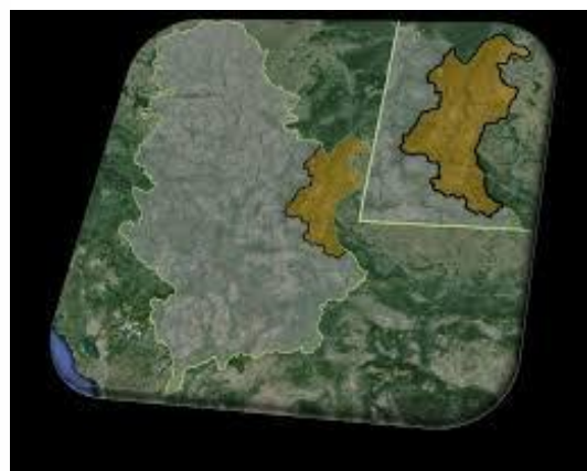
Слика. 1. – Карта Кладова

Општина Кладово је најмања општина не само у Борском округу већ и у целој Тимочкој крајини. Површином од 629 км 2 захвата област Кључ, која је тако названа по великом Дунавском меандру, као и делове Ђердапске клисуре (Пецка бара - Давидовац) и Неготинске крајине (Слатинска река - Милутиновац).